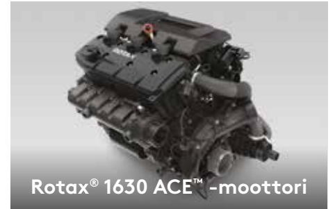
Rotax® 1630 ACE™-moottori

Tilava etusäilytystila on helposti käytettävissä istuma-asennosta käsin. 1