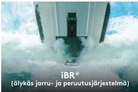
iBR® (älykäs jarru- ja peruutusjärjestelmä)

Markkinoiden suurimman uimatason ainutlaatuisen pikakiinnitysjärjestelmän avulla on helppo kiinnittää säilytystarvikkeet.