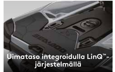
Uimatason integroidulla LinQ™-järjestelmällä

Markkinoiden ensimmäinen valmistajan asentama, täysin vesitiivis Bluetooth ® -audiojärjestelmä