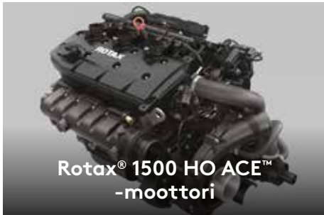
Rotax® 1500 HO ACE™ -moottori

Tämä tehokas moottori on varustettu ACE-tekniikalla (Advanced Combustion Efficiency), huoltovapaalla ahtimella 1 ja ulkoisella välijäähdyttimellä, ja se on optimoitu tavallista polttoainetta varten polttoainetaloudesta tinkimättä.