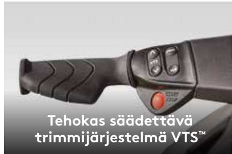
Tehokas säädettävä trimmijärjestelmä VTS™

Tämä tehokas moottori on varustettu ACE-tekniikalla (Advanced Combustion Efficiency), huoltovapaalla ahtimella 1 ja ulkoisella välijäähdyttimellä, ja se on optimoitu tavallista polttoainetta varten polttoainetaloudesta tinkimättä.