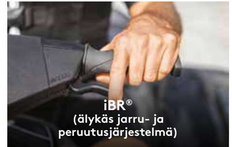
iBR® (älykäs jarru- ja peruutusjärjestelmä)

Ohjaustangon nopean pikasäädön avulla kuljettaja voi helposti mukauttaa trimmiasennon vaihtuvien olosuhteiden mukaan.