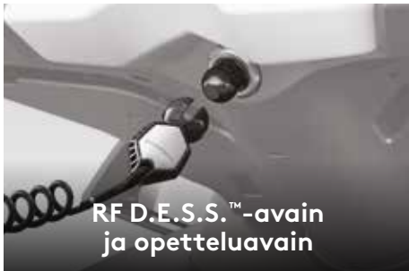
RF D.E.S.S.™ -avain ja opetteluavain

110-litraisessa säilytyslaatikossa on reilusti tilaa tärkeille varusteille ajon ajaksi. 1