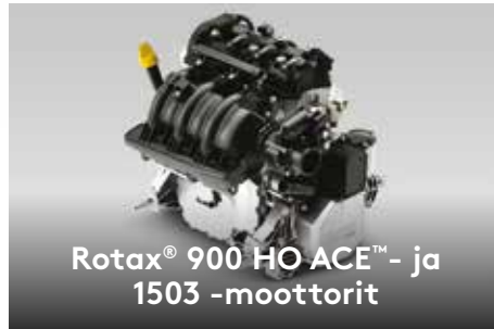
Rotax® 900 HO ACE™ - ja 1503 -moottorit

Sea-Doo-vesijettien ainutlaatuinen iBR®-järjestelmä pysäyttää vesijetin nopeammin sekä parantaa hallittavuutta ja ohjattavuutta alhaisissa nopeuksissa ja peruutettaessa.