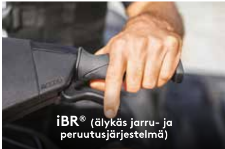
iBR® (älykäs jarru- ja peruutusjärjestelmä)

Sea-Doo-vesijettien ainutlaatuinen iBR®-järjestelmä pysäyttää vesijetin nopeammin sekä parantaa hallittavuutta ja ohjattavuutta alhaisissa nopeuksissa ja peruutettaessa.